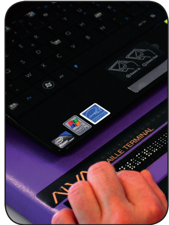
Tablette braille utilisée pour lire en braille ce qui est affiché à l'écran . → Figure et légende

Les lecteurs d'écran utilisés par les personnes aveugles ou malvoyantes intègrent des fonctions pour lire et naviguer dans les PDF balisés.